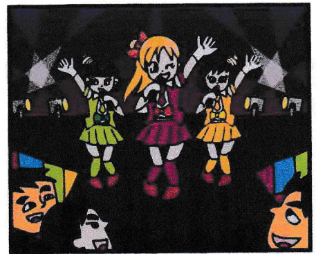
不特定の客にショー、ダンス、演芸その他の興行等を見せる行為