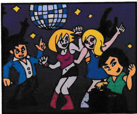
客にダンスをさせる場所を設けるとともに、音楽や照明の演出等を行い、不特定の客にダンスをさせる行為