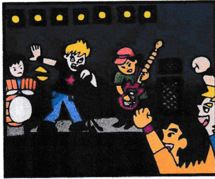
不特定の客に歌手がその場で歌う歌、バンドの生演奏等を聴かせる行為